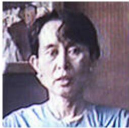
Burma: 19 Years of Protest