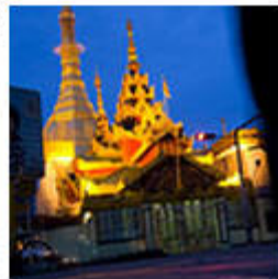
Behind Burma's Discontent