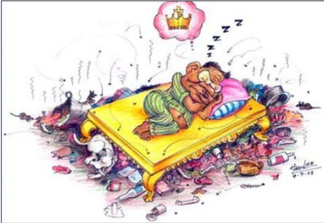
2003 အမြင်သစ်သတင်းစာမှ သန်းရွှေအိပ်မက် အကောင်ထည်ပေါ်ပြီလား