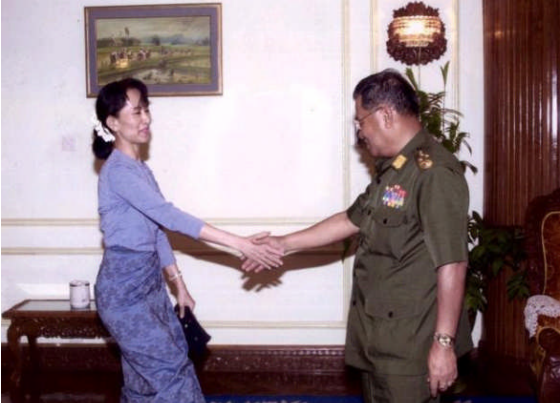
Last 10 years ago. လွန်ခဲ့တဲ့ ၁၀နှစ် ဦးသန်းရွှေ၊ ဒေါ်အောင်ဆန်းစုကြည်