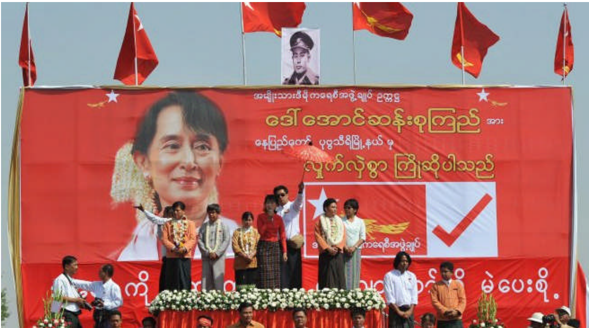
Now 2012: ဦးသန်းရွှေ အနားယူပြီး၊ ဒေါ်အောင်ဆန်းစုကြည် နှင့် NLD ရွေးကောက်ပွဲအနိုင်ရ