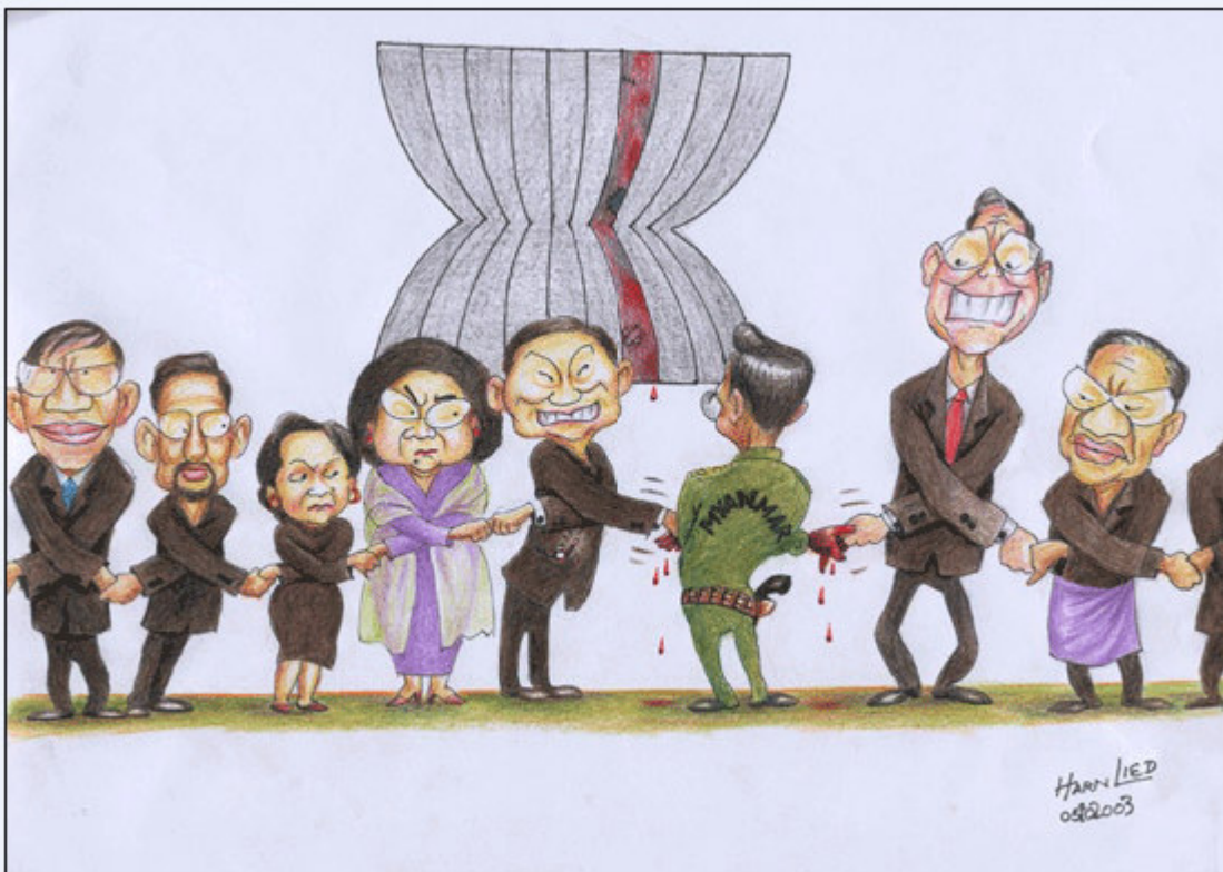
အမြင်သစ်သတင်းစာမှ 2003 ခင်ညွန့်၊ ယခု 2010 သိန်းစိန် (Dr.Mg Mg ဝင်စားသူ)