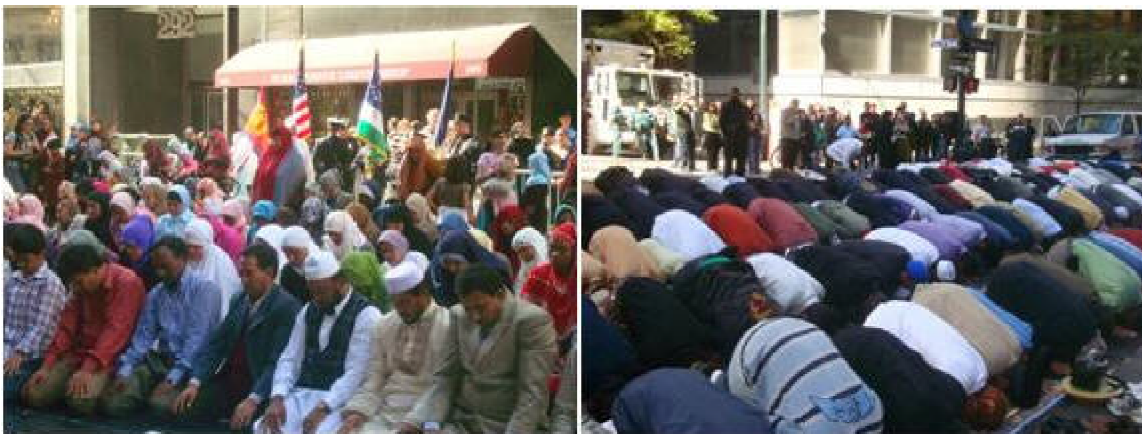
New York City on Madison Avenue Photo @ 2010 Friday afternoon in several locations throughout NYC where there are mosques with a large number of Muslims that cannot fit into the mosque