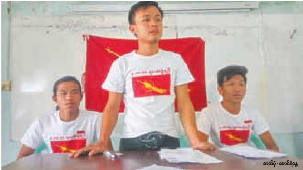
ကျောင်းသားထုအခွင့်အရေးနှင့်ပတ်သက်၍ တက္ကသိုလ်အတွင်းလှုပ်ရှားမှုများကို တက္ကသိုလ်အာဏာပိုင်များက ပိတ်ပင်တားဆီးနေခြင်းနှင့် ပတ်သက်၍ မိတ္ထီလာ တက္ကသိုလ် ကျောင်းသားများသမဂ္ဂအဖွဲ့ဝင်များက မန္တလေးမြို့တော်ရှိ နိုင်ငံရေးအကျဉ်းသားဟောင်းများ ကွန်ရက်ရုံးခန်းတွင် ဖေဖော်ဝါရီလ ၆ ရက်နေ့ နံနက် ပိုင်းက ရှင်းလင်းနေစဉ်။ ယင်းတက္ကသိုလ်ကျောင်းသားသမဂ္ဂကို ၂၀၁၆ ခုနှစ် ဇူလိုင်လက ပြန်လည်ဖွဲ့စည်းခဲ့ခြင်းဖြစ်သည်။