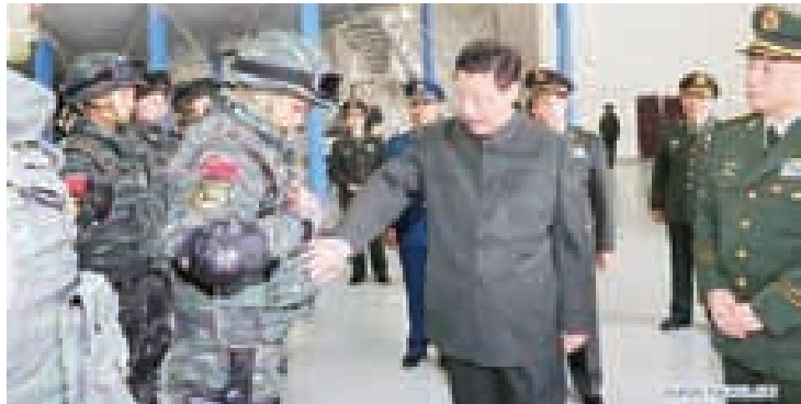
တရုတ်ထိပ်တန်းရဲဌာနသည် ကေဂျီဘီပုံစံစွဲစည်းထားပြီး နိုင်ငံတော်လုံခြုံရေးကိစ္စများကို ကိုင်တွယ်သည်

သော ထိပ်တန်းအရာရှိများကို ဖယ်ရှားပစ် မည်ဟု ကြိုးပမ်းခဲ့ကာ ဒါဇင်ပေါင်းများစွာ သော အစိုးရ ပါတီနှင့် တပ်မတော်ခေါင်း ဆောင်များကို ဖြုတ်ထုတ်ဖမ်းခဲ့သည်။