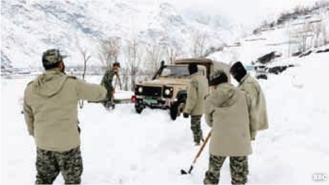
ပါကစ္စတန်နိုင်ငံ ချီထရာဒေသတွင် နှင်းခဲပြိုကျမှုဖြစ်သည့်နေရာသို့ရောက်အောင် ကြိုးပမ်းနေသော ကယ်ဆယ်ရေးလုပ်သားများ