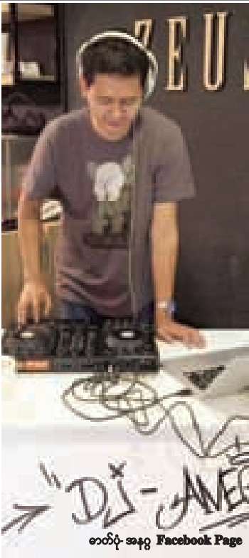
ဇာတ်ပုံ အနဂ္ဂ Facebook Page

“ကျွန်တော့်အယူအဆကတော့ စတူဒီယိုဆိုတာက ကျွန်တော်တို့ ဂီတသမားတွေအတွက် ဟိုတယ်လိုပဲ။ ဟိုတယ်သွားရင် သက်သောင့်သက်သာ နေချင်သလို၊ စတူဒီယိုသွားရင်လည်း ပစ္စည်းအစုံ သုံးချင်တယ်။ လက်တစ်ကမ်းမှာ အကုန်ရချင်တယ်ဆိုတော့ အဲဒီလိုမျိုး ဖြစ်အောင် ကျွန်တော်က စီစဉ်ပေးထားပါတယ်။ နောက်ပြီးစတူဒီယိုထဲမှာ အနံ့အသက်ကင်းအောင် သန့်ရှင်းမှုရှိအောင်လည်း ဂရုစိုက်ထားပါတယ်” လို့ ၎င်းက ဆိုပါတယ်။