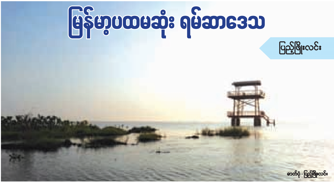
ပြည့်ဖြိုးလင်း

ရေတိမ်ဒေသသည် ရေကိုထိန်းညှိပေးသည့်စနစ်ဖြစ်သကဲ့သို့ အပင်နှင့်သွားငှက်တိရစ္ဆာန်များ၊ ရေပျော်ငှက်များနှင့် ကမ္ဘာ့ဆောင်းခိုငှက် နေထိုင်ကျက်စားရာနေရာများဖြစ်ပြီး လူတို့အတွက်လည်း အပန်းဖြေရေးဆိုင်ရာတန်ဖိုးများရှိသည့်အတွက် ရေတိမ်ဒေသများတိမ်ကော