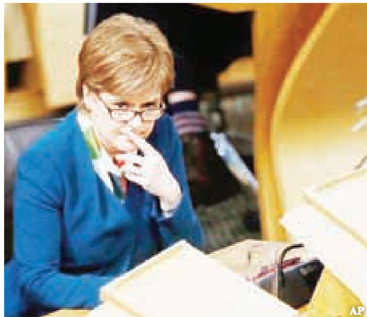
ဂရီယားသည် ၂၀၁၄ ခုနှစ်တွင် တွဲရေးဘက်က နိုင်သွားသည့် လွတ်လပ်ရေးဆန္ဒခံယူပွဲတွင် ခွဲရေးဘက်က မဲဆွယ်ခဲ့သူဖြစ်သည်