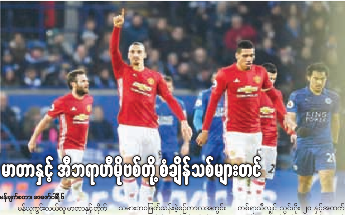
မန်ချက်စတာ၊ ဖေဖော်ဝါရီ ၆

○ အမေရိကန်ဖွတ်ဘော ဆူပါဘောင်းလ်ဗိုလ်လွှဲအဖြစ် New England Patriots နှင့် Atlanta Falcons အသင်းတို့ ယှဉ်ပြိုင်ကစားခဲ့သည့်ပွဲစဉ်တွင် New England Patriots က ၃၄ မှတ် ၂၈ မှတ်ဖြင့် အနိုင်ရရှိပြီး ချန်ပီယံဖြစ်သွားခဲ့ကြောင်း AP က ဖော်ပြထားသည်။ New England Patriots နှင့် Atlanta Falcons တို့၏ဗိုလ်လွှဲကို ဟောက်စတန်မြို့တွင် ကျင်းပခဲ့ခြင်းဖြစ်ပြီး ပြိုင်ပွဲမစတင်မီတွင် ကောင်းကင်ယံထက်၌ အမေရိကန်ပြည်ထောင်စုအလံကို Backdrop ပုံဖော်ပြခဲ့သည်မှာ လွန်စွာရင်သပ်ရှုမောဖွယ်ကောင်းလွန်းခဲ့သည်။ ပြိုင်ပွဲကျင်းပရေးကော်မတီသည် ၎င်းတို့အနေနှင့် ယင်းပြကွက်ကို ဒရန်းလေယာဉ်အစီး ၃၀၀ အသုံးပြု၍ဖန်တီးခဲ့ကြောင်း ရှင်းလင်းအသိပေးထားပြီဖြစ်သည်။