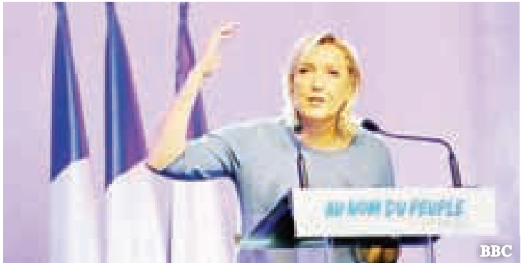
ပြင်သစ်သမ္မတလောင်း လီပန်