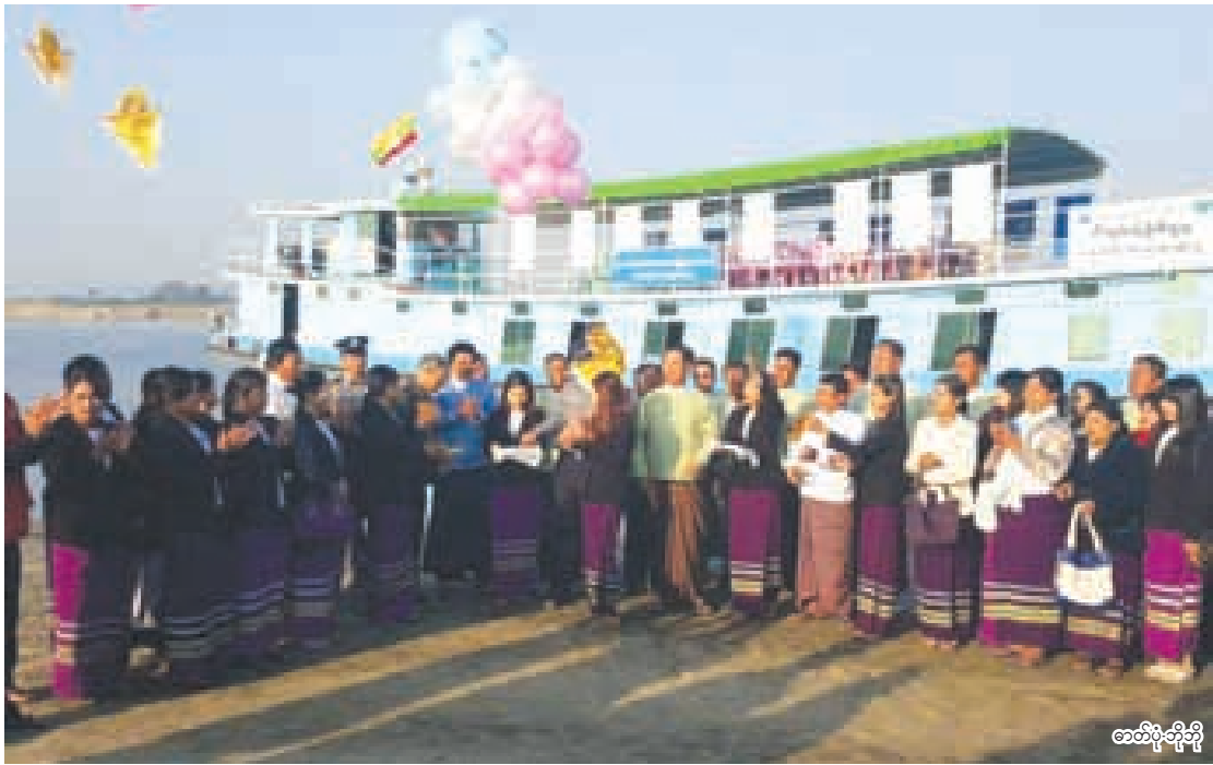
ဧရာဝတီလင်းပိုင် စစ်တမ်းကောက်ယူရေးခရီးစဉ်တွင် မန္တလေးဆိပ်ကမ်းတွင် ပြုလုပ်နေစဉ်။