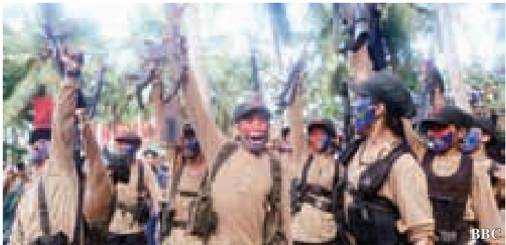
ဖိလစ်ပိုင်အစိုးရနှင့် သူပုန်များအကြား ပဋိပက္ခကြောင့် လူထောင်နှင့်ရိုဂျီသေဆုံးခဲ့ရသည်

နော်ဝေးတွင်ကျင်းပမည့် ဆွေးနွေးပွဲကို ဖျက်သိမ်းလိုက်ပြီး အစိုးရညှိနှိုင်းရေးတာဝန်ခံများကို ပြန်လာရန် ညွှန်ကြားထားသည်ဟု ဒူတာတေးက ပြောကြားသည်။