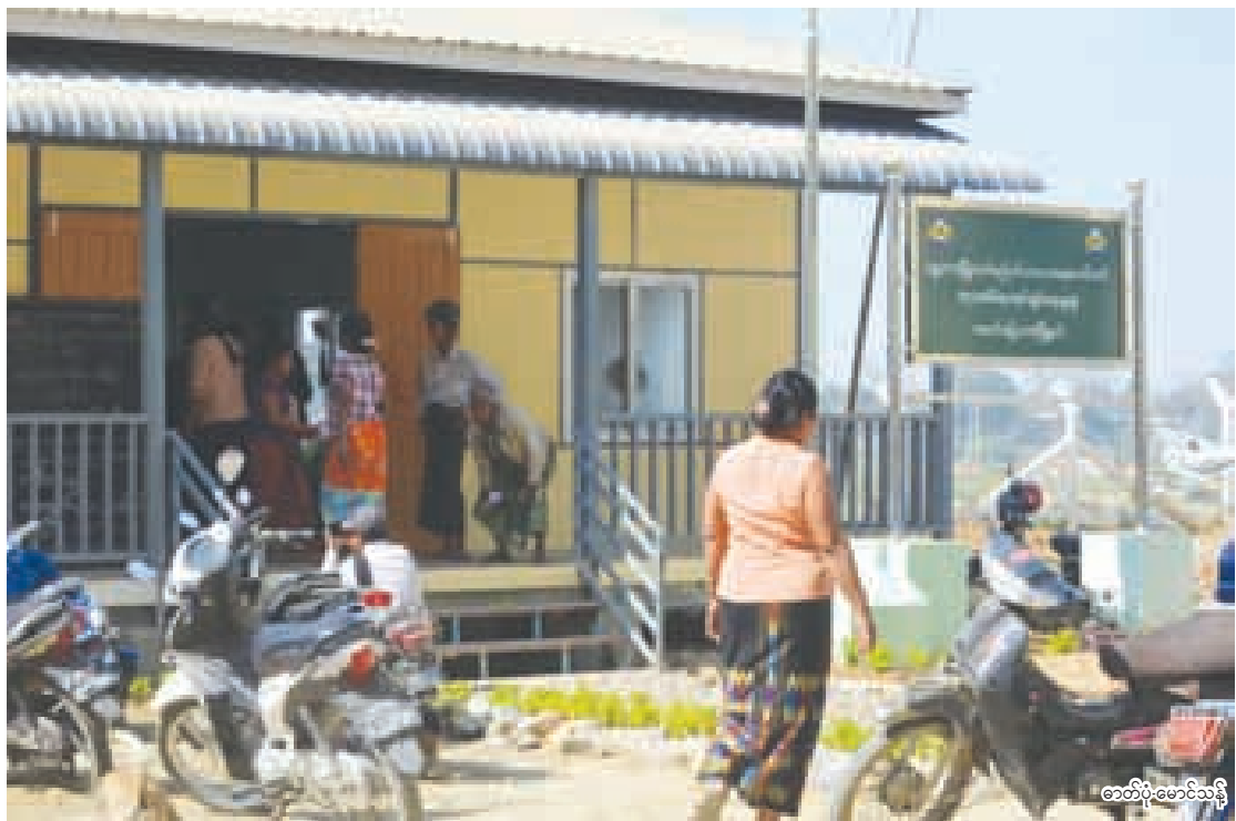
အခန်းငှားခ၊ တစ်နှစ်စာ ရေအသုံးစရိတ်နှင့် လျှပ်စစ်မီး မီတာခများကို တစ်ပြိုင်တည်းကောက်ခံမှုကြောင့် အိမ်ခန်းငှားနေထိုင်သူအချို့ အငှားအိမ်ရာ အုပ်ချုပ်ရေးမှူးရုံးတွင် လာရောက်ဖြေရှင်းနေစဉ်။