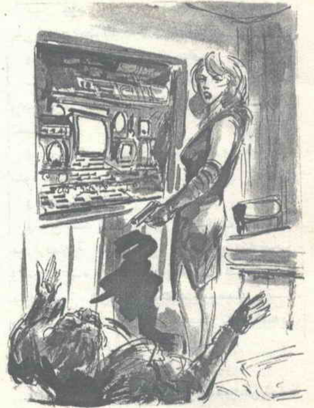
استدارت إليه بحركة حادة عنيفة ، وارتفعت يدها نحوه بمسدس صغير ..

كانت تبدو وكأن كيانها كله قد تعلق بهذه الأزرار ..